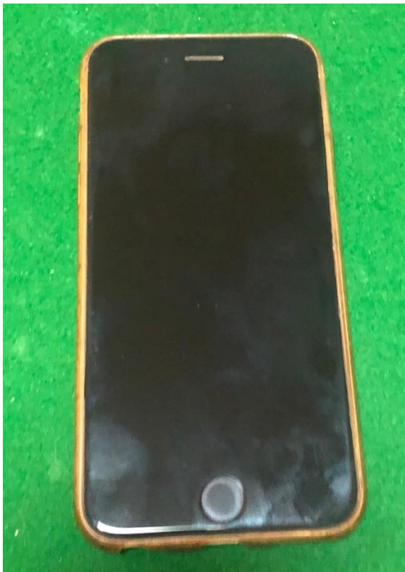
Apple iPhone 6S 64 GB Space Gray