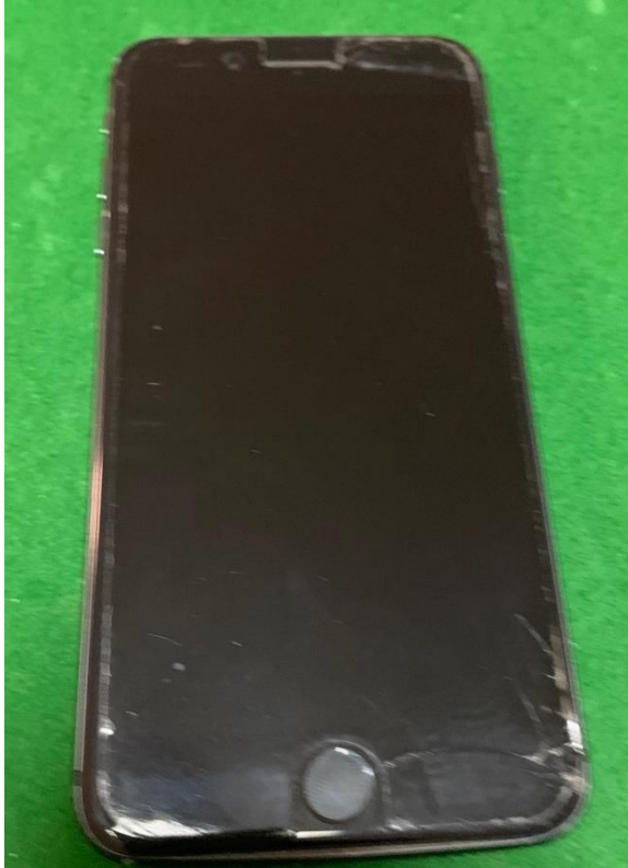
Apple iPhone 5 32 Gb Black