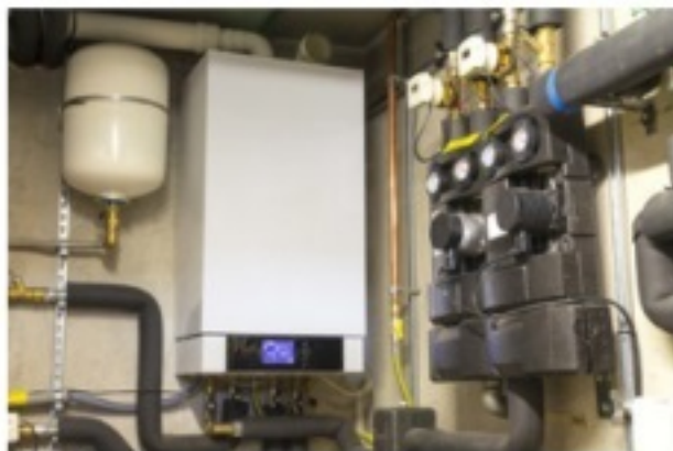
Caldaia a condensazione

Nel caso di generatori di calore si può scegliere, ad esempio, tra una caldaia a condensazione