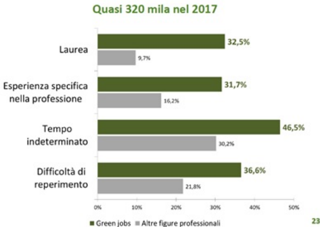
Fig. 02 La domanda di green jobs delle imprese (Rif. Unioncamere)

Quasi il 60% delle figure professionali inserite nelle aree aziendali della progettazione e della ricerca e sviluppo sono green: testimonianza di come l'innovazione e la competitività costituiscano tratti fondamentali della green economy.